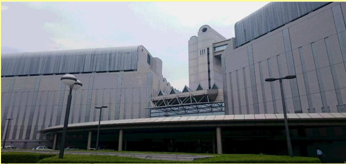
【学会及び展示会場】